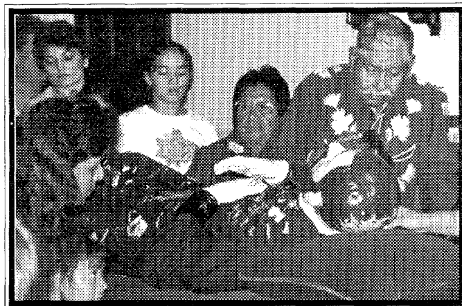
Una devoción en honor a San Francisco Javier